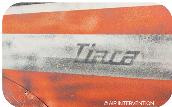
2023 : Remise en état de l'avion totem HR100-320 Tiara S/N n°003, emblème de l'aérodrome de Sorigny. Découverte de la peinture d'origine - 1969.